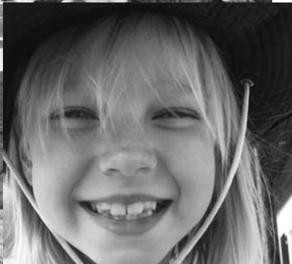
Lutins, un sourire à Charmey