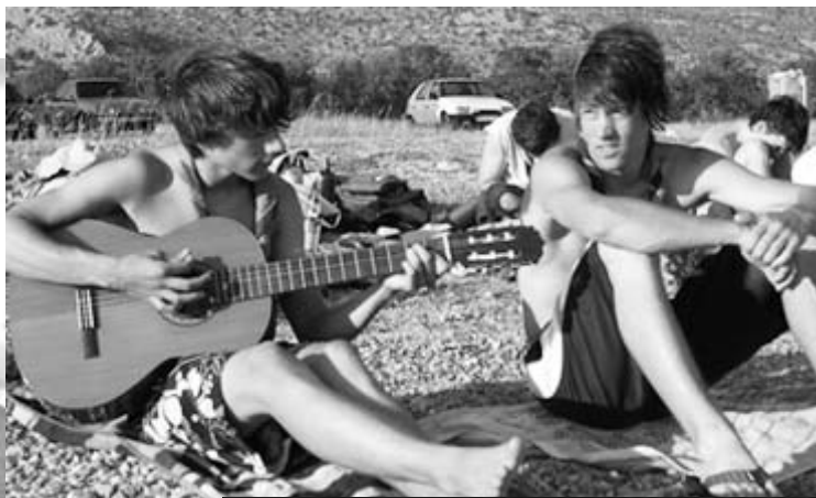
Pionniers, guitare en Croatie