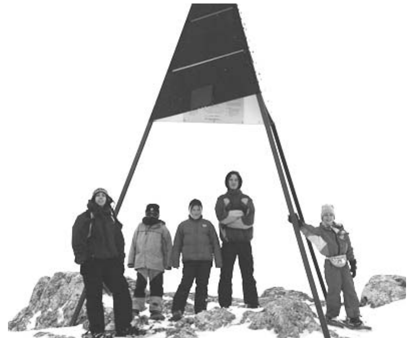
En raquettes au sommet du Chasseron