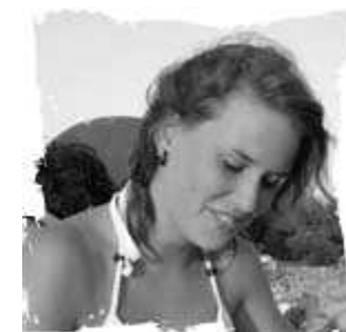
CTA Kersay Pultau