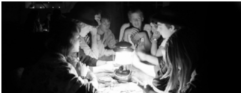
Au cours COsmOS