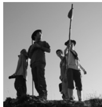
Au sommet de la tour