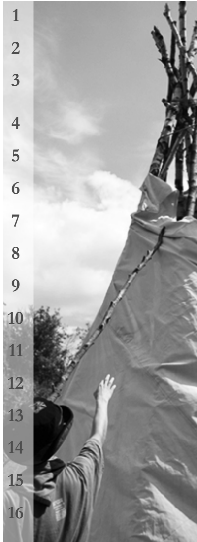
La construction d'un Tepee