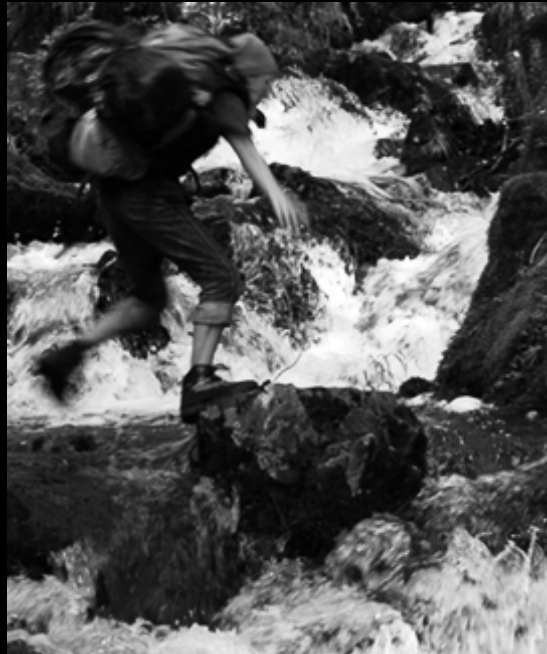
Le grand saut