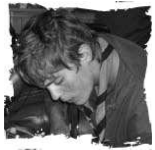
CTA Etienne Kocher