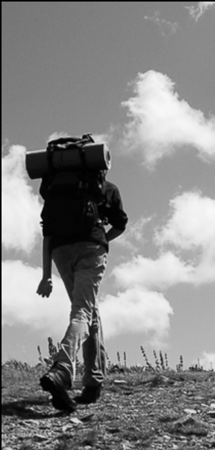
Trek dans les Vosges